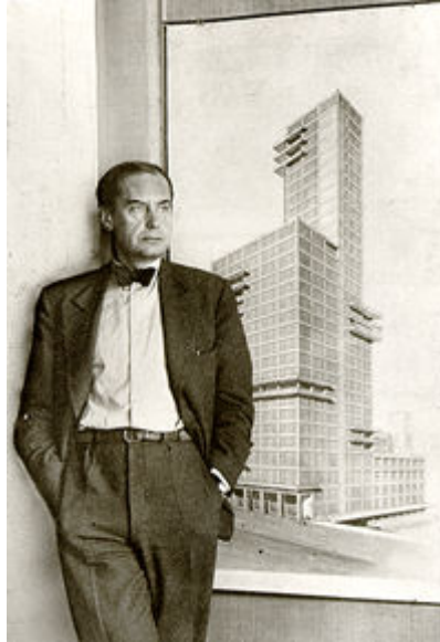
والتر گروپیوس در کنار طرح پیشنهادی خود برای برج شیکاگو تریبون