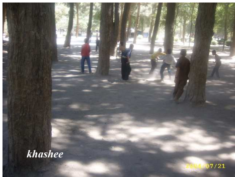
کودکان که مکان برای ورزش ندارند، در میان درختان فوتبال بازی می کنند.

آرا و افکاری که جزئی از قوانین نانوشته شده ی جاری در کشور است و هیچ کس مرجع صدور آن را نمی داند ولی بدان پایند است. خوب فراموش نشود که قانون اساسی خود بر بنیاد این آرا و افکار بنا یافته است. من قادر نیستم که همه ی مشاهداتم را فقط در یک مقاله بگنجانم، چون هر کدام و هر موردی خود محتاج بحث جداگانه ی است.